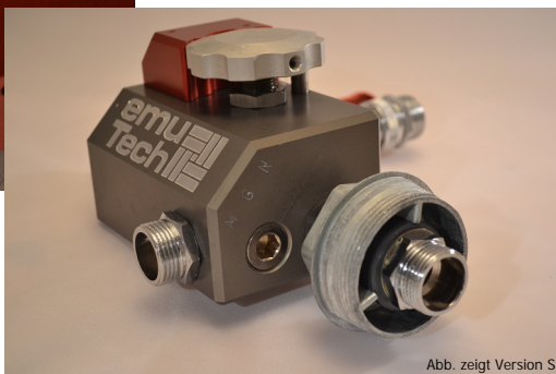
Abb. zeigt Version S